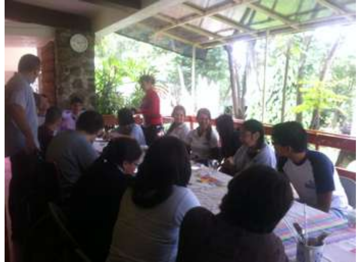
ENCUENTROS QUE TRNSFORMAN VIDAS